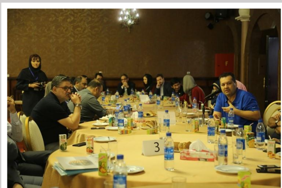
جسارت رو در رو