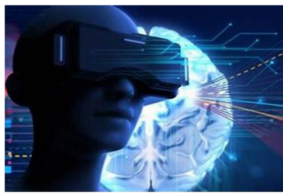
Health Tech Talk