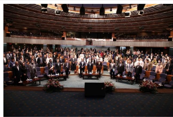
مراسم رسمی رویداد